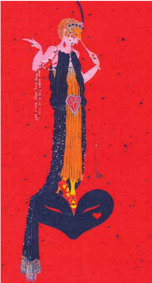
Maquette de costume de L'Amour Masqué , Frédéric Pineau